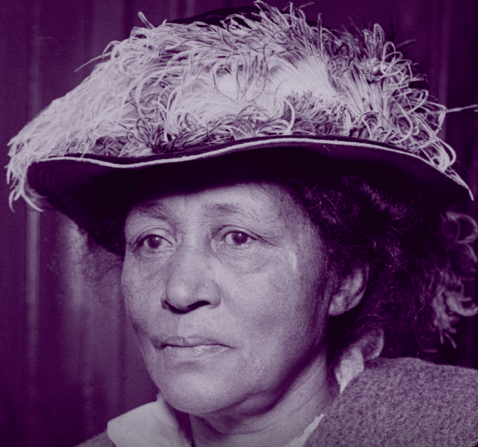
Lucía González Parsons

Hoy, Día Internacional de las Mujeres, recordamos todo los hechos de las Mujeres Rebeldes del mundo. Y si hay un día perfecto para recordar a las brillantes estrellas femeninas de los Trabajadores Industriales del Mundo, este es el día. Estas son solo algunas de las mujeres más destacadas de los Wobblies.