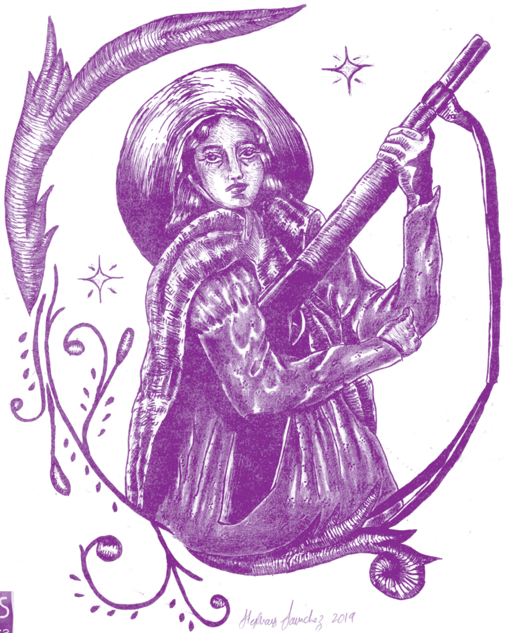
“Adelita”, 2019. Lithografía por Stephany Sanchez

Sinceramente para una pronta abolición de la esclavitud doméstica, Jane Street