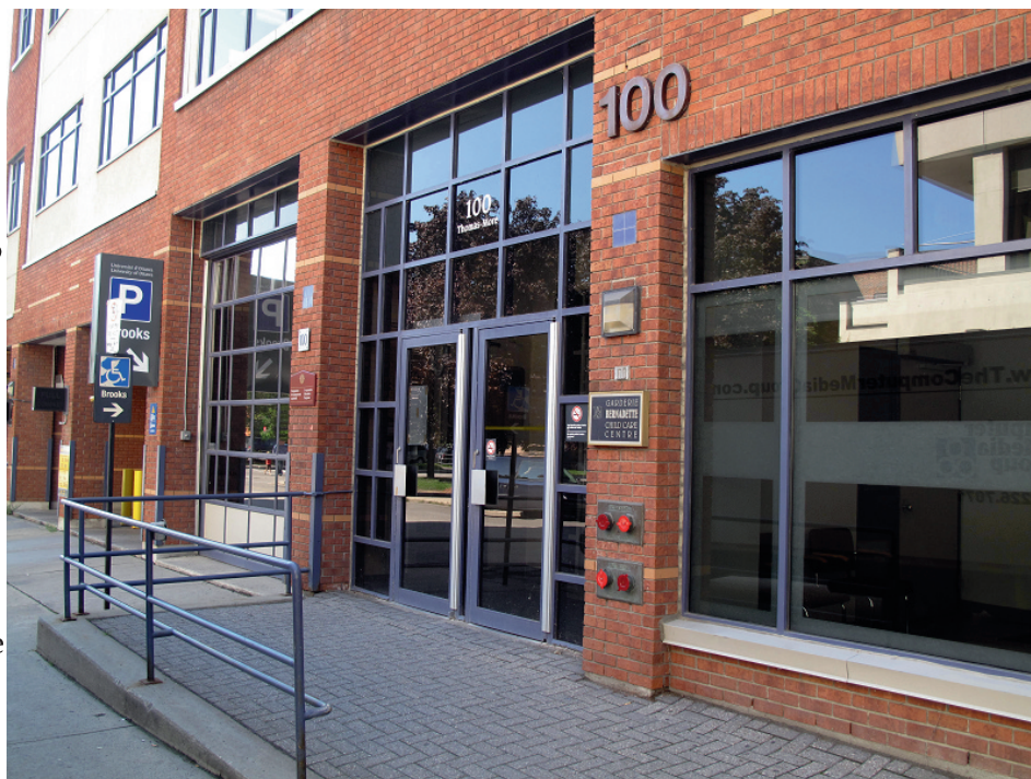
La puerta principal del edificio Brooks en donde está localizado la guardería Bernadette. La universidad tiene planes para derrumbar el edificio pero no para relocalizar la guardería.

Como lo expresó Compañera VJ: “Somos un grupo pequeño y unido de personas, y una vez que comenzamos a hablar juntos uno a uno, nos dimos cuenta de que todos sentíamos lo mismo. Muchos